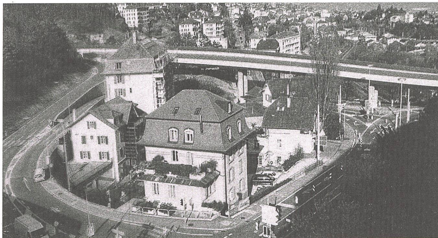
Panneaux solaires, ventilation double-flux et isolation traquent le gaspillage énergétique et le bruit à Neuchâtel.

C'est la première fois qu'un édifice antérieur au 20 e siècle obtient le label «MINERGIE». Depuis la mise en service du bâtiment rénové, en 2001, une maison plus ancienne encore, datant du 17 e siècle et classée monument historique, a également obtenu cette qualification à Lutry.