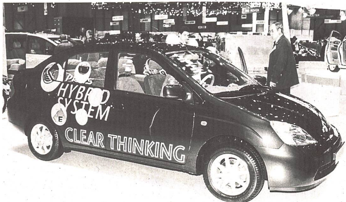
La Toyota Prius est la première voiture hybride de série. En combinant essence et électricité, elle consomme environ 5 l/100 km.