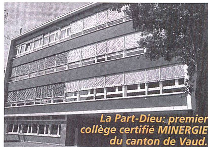
La Part-Dieu: premier collège certifié MINERGIE du canton de Vaud.