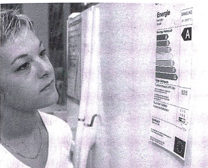
Etiquette pour appareils ménagers

Avantages. L'étiquette Energie indique la consommation de carburant en l/100 km, l'émission de CO 2 en g/km, ainsi que la consommation relative. Elle encourage l'auto-