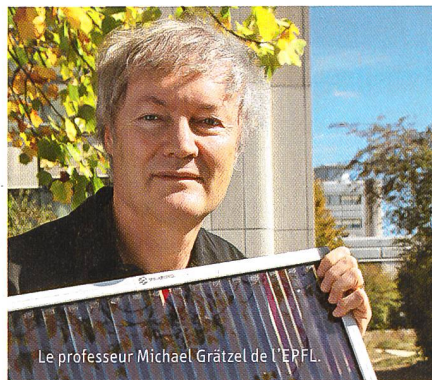
Le professeur Michael Grätzel de l'EPFL.

Le «swisselectric research award 2012» a été décerné au chimiste Michael Grätzel pour ses remarquables recherches dans le domaine de la transformation électrochimique de l'énergie. La principale découverte de sa longue carrière de chercheur est un nouveau type de cellule photovoltaïque inspiré du processus naturel de la photosynthèse. A la fois peu coûteux à fabriquer et plus efficace que les cellules classiques dans des conditions de lumière diffuse, il ouvre à l'énergie solaire de nouveaux horizons.