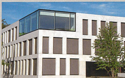
La maison communale de Regensdorf.

C'est le nombre actuel des Cités de l'énergie en Suisse. Regensdorf, la 300 e , a reçu le label au début octobre 2012 en présence de la conseillère fédérale Doris Leuthard. Avec quelque 17 000 habitants et une surface de 14,6 km 2 , Regensdorf est l'une des plus grandes communes de la région de l'Unterland zurichois (nord-ouest de Zurich). Le nombre de Cités de l'énergie est en forte augmentation en Suisse. A ce jour, elles abritent un habitant sur deux.