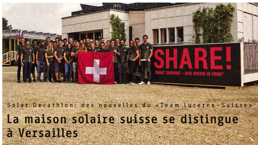
Solar Decathlon: des nouvelles du «Team Lucerne-Suisse»

Au milieu de l'année, deux pôles de compétence en recherche énergétique dans le champ d'action «Efficacité énergétique» ont commencé leurs activités. Les sept champs d'action définis dans le plan d'action «Recherche énergétique suisse coordonnée», sont ainsi couverts par des Swiss Competence Centers for Energy Research (SCCER) appropriés. Pour les années 2014 à 2016, près de 10 millions de francs seront alloués au développement des capacités de recherche et l'exploitation dans le champ d'action «Efficacité énergétique». A eux deux, les pôles couvrent les thèmes-clés du champ d'action. Le Laboratoire fédéral d'essai des matériaux et de recherche (Empa) constitue la Leading House du SCCER «Future Energy Efficient Buildings and Districts – FEED&D», l'Ecole polytechnique fédérale de Zurich (EPFZ) celle du SCCER «Efficiency of Industrial Processes – EIP».