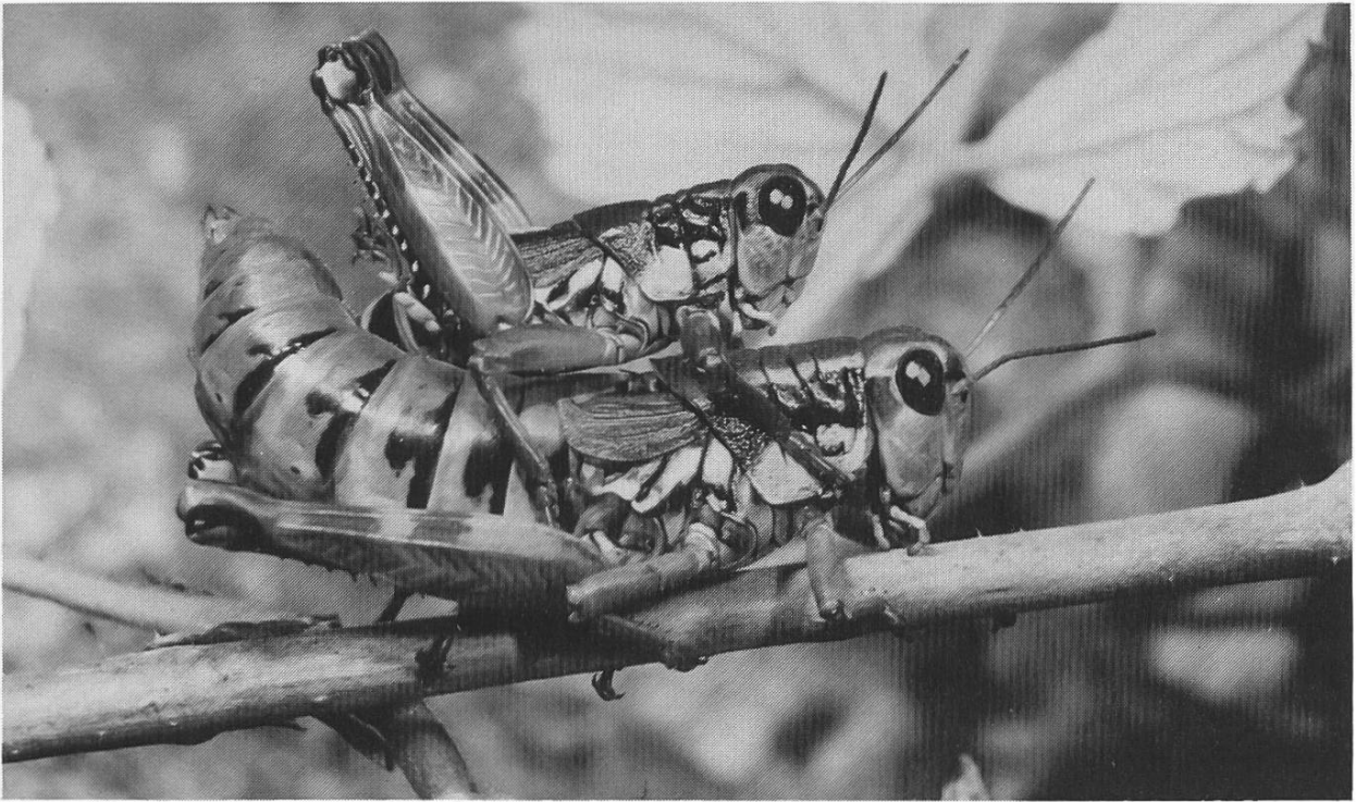
1. Preis : Kopula der Gewöhnlichen Gebirgsschrecke ( Podisma pedestris L.) Plän Marener, 1450 m ü.M., Val Bondasca, Bondo/GR, 7. September 1986.