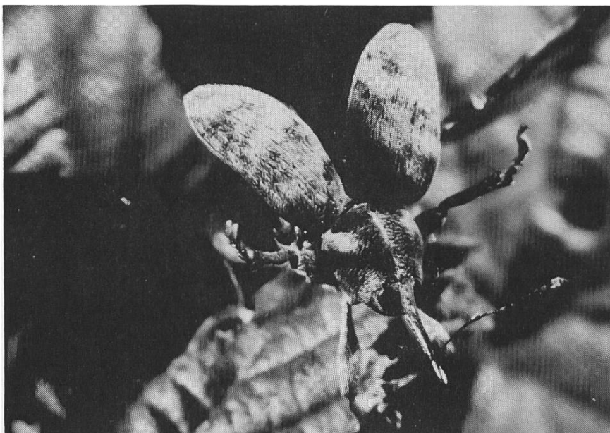
3. Preis : Haselnussbohrer ( Curculio nucum L.).