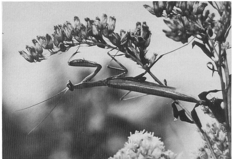
3. Preis : Gottesanbeterin ( Mantis religiosa L.)