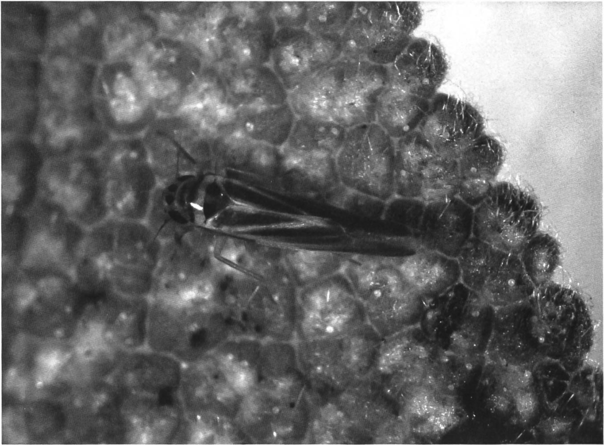
Abb. 1. Adultier von H. distinguenda