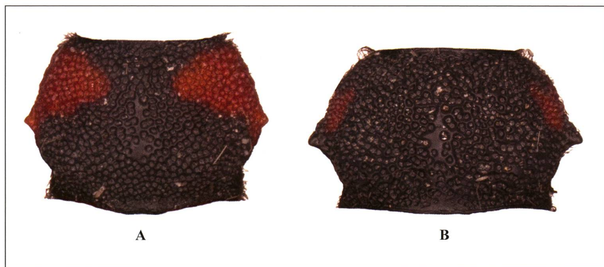
Fig. 2. Pronotum de A) P. globulicollis et B) P. kaehleri . Mêmes individus que Fig. 1.