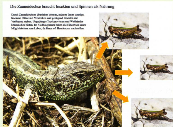
Abb. 2. Tafel zur Nahrungsökologie der Zauneidechse.