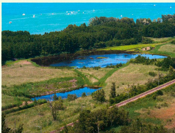
Abb. 3. Neu geschaffene Gewässer in der Grande Cariçaie am Neuenburgersee zwischen Châbles und Cheyres.

Die Exkursion vom 10. September 2011 führte in das Tal von La Brévine im Neuenburger Jura, wo in Höhenlagen über 1000 m Restflächen der einst ausgedehnten Hochmoore regeneriert werden. An den Beispielen der Gebiete Les Saignes-Jeanne und Le Marais bei Le Cerneux-Péquignot sowie Marais Rouges bei Les Ponts-de-Martel erklärte Sébastien Tschanz, Leiter der Projekte im Auftrag des Kantons, wie bei der Regeneration vorgegangen wird. Wichtigstes Ziel der Vorhaben ist, den Grundwasserstand zu heben und nährstoffreiches Wasser vom Torfkörper abzuhalten. Dabei werden die alten Entwässerungsgräben mit Sägemehl und feinen Holzschnitzeln verfüllt, womit sich das Wasser wieder aufstaut. Erfolge haben sich bereits eingestellt. In den Mooren von Le Cerneux-Péquignot sind neue mesotrophe Gewässer entstanden, in denen sich unter mehreren Libellenarten auch die Grosse Moosjungfer Leucorrhinia pectoralis (Charpentier, 1825) angesiedelt hat. Exuvienfunde belegen, dass sich die schweizweit seltene Moorart hier nun fortpflanzt. An anderer Stelle haben sich im einst abgetrockneten, kürzlich stark ausgelichteten Hochmoorwald zwischen den nun