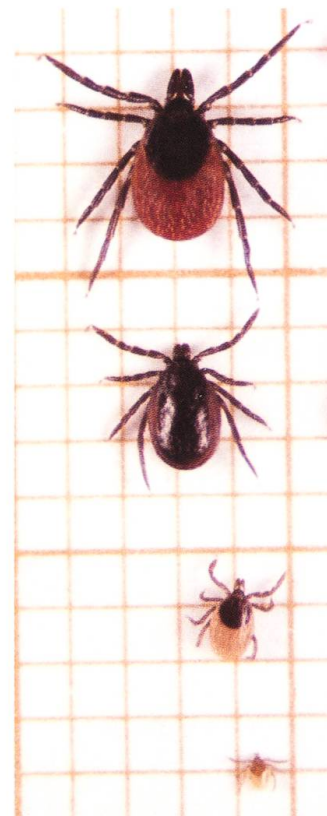
Fig. 2 (à droite). Tiques Ixodes ricinus . De bas en haut: larve, nymphe, mâle adulte et femelle adulte (1 carré = 1 mm 2 ). (Photo Olivier Rais, Université de Neuchâtel)

Les fourmis ont été collectées dans une fourmilière de taille moyenne en mai 2013. Environ 100 ouvrières ainsi que du matériel végétal provenant du nid ont été récoltés et transportés dans une boîte fluonnée pour empêcher les fourmis de sortir. Les tiques I. ricinus proviennent de l'élevage du laboratoire d'éco-épidémiologie de l'Université de Neuchâtel. Des femelles adultes, des nymphes gorgées de sang et des nymphes avant leur repas sanguin ont été utilisées.