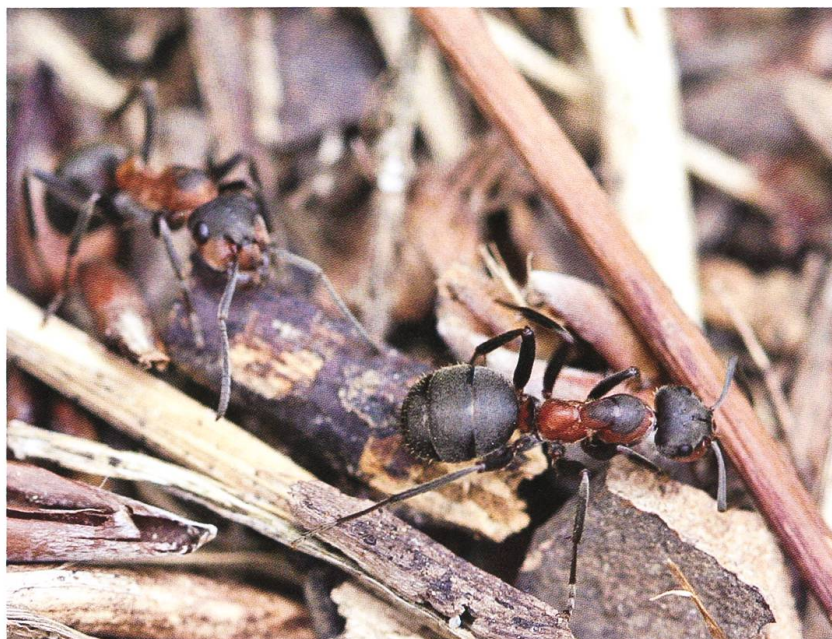
Fig. 1 (à gauche). Ouvrières de Formica pratensis .