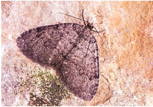
Abb. 25. T. tauteli , ♀.