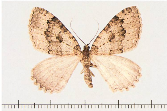
Abb. 11. T. tauteli , ♀, Chasseral (BE), 07.05.1988