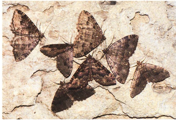
Abb. 22. T. dubitata .