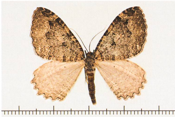
Abb. 3. T. dubitata , ♂, Chasseral (BE), 11.10.1984