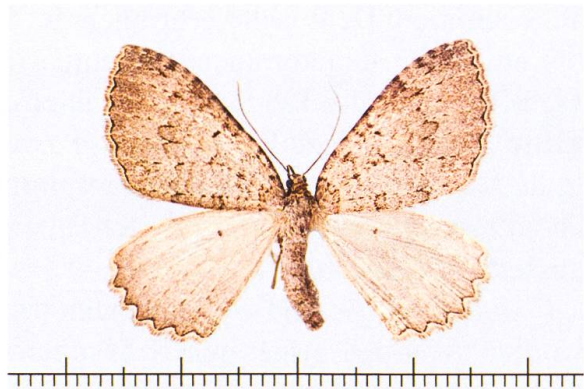
Abb. 8. T. tauteli , ♀, Chasseral (BE), 07.05.1988.