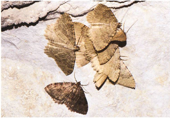
Abb. 21. T. sabaudiata und T. dubitata .