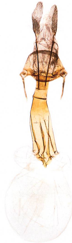
Abb. 20. T. tauteli , ♀.