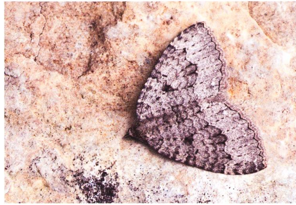
Abb. 26. T. tauteli , ♀.