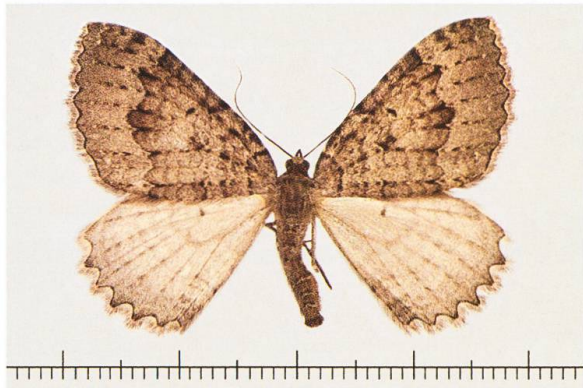
Abb. 13. T. tauteli , ♀, Kandersteg, (BE), 01.05.1999