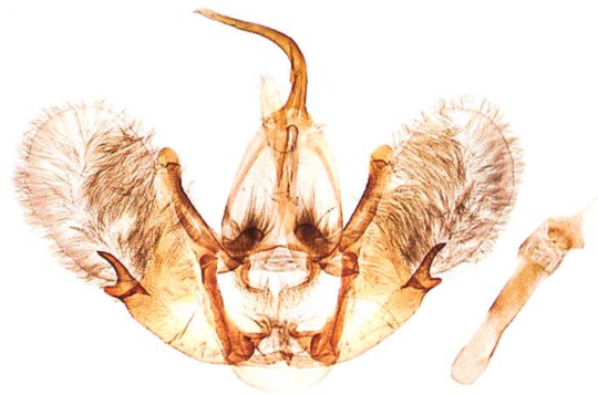
Abb. 17. T. tauteli , ♂.