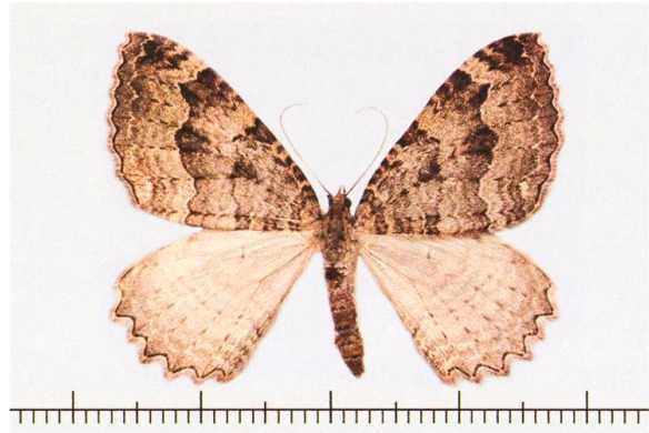
Abb. 4. T. dubitata , ♀, Chasseral (BE), 31.03.1981