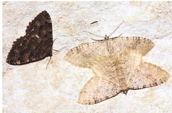
Abb. 24. T. dubitata und Kopula von T. sabaudiata .

diesem Datum im Stollen von Gänsbrunnen kein einziges lebendiges Männchen, weder von T. tauteli noch von T. dubitata oder T. sabaudiata feststellen.