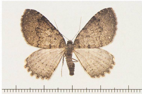
Abb. 14. T. tauteli , ♀, Oberwil i.S. (BE), 14.11.2013

15. Oktober und betreffen Beobachtungen bei Lichtfängen. Aus Höhlen ist nur ein einziger konkreter Fund eines lebenden Männchens belegt: Vallorbe (VD), 31.10.2013. Für die Weibchen liegen die Funde ohne grössere zeitliche Lücken vom 27. Juli über den Winter bis zum 8. Juni vor, wobei alle Funde zwischen dem 14. Oktober und 10. Januar Beobachtungen in Höhlen betreffen, dies sind über 50 Exemplare. Nach der Überwinterung ab dem 5. April wurden alle belegten Weibchen (17 Expl.) am Licht beobachtet.