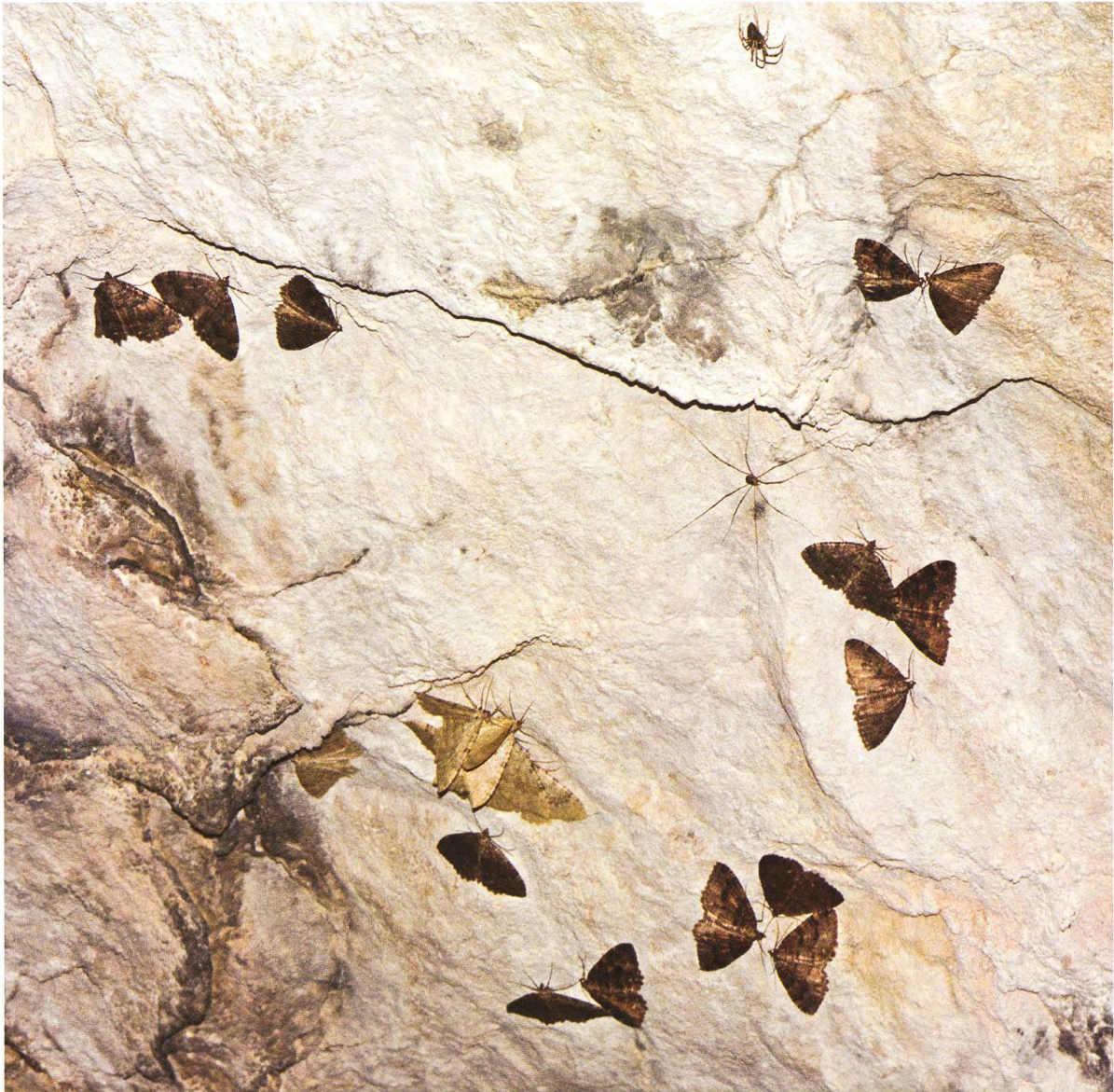
Abb. 29. Höhlenüberwinterer