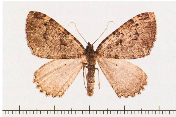
Abb. 6. T. dubitata , ♂, Kiental (BE), 29.09.1956.