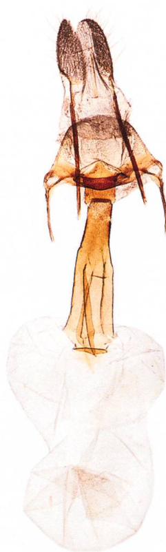
Abb. 19. T. dubitata , ♀.