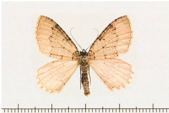
Abb. 7. T. tauteli , ♂, Chasseral (BE), 22.08.1982