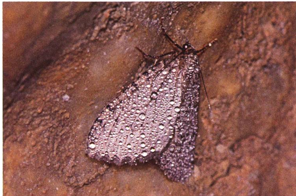
Abb. 27. T. tauteli .