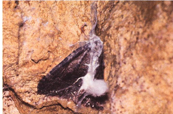
Abb. 28. T. dubitata , verschimmelt

bei T. sabaudiata in den Höhlen meistens sehr ausgeglichen zu sein. Mehrfach sind auch Falter in Kopula beobachtet worden (Abb. 24), dagegen konnte bis Januar kein einziges totes, verschimmelt Exemplar gefunden werden.