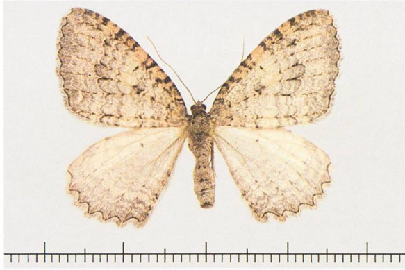
Abb. 9. T. tauteli , ♀, Vallorbe (VD), 31.10.2013