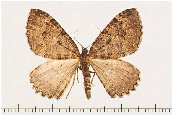
Abb. 5. T. dubitata , ♂, Trimbach (SO), 02.12.2013