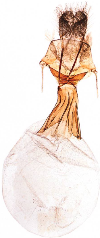
Abb. 18. T. sabaudiata , ♀.