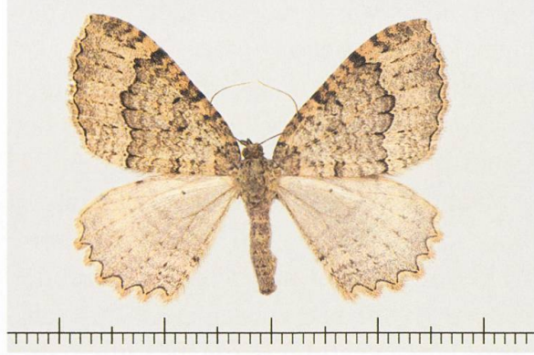
Abb. 10. T. tauteli , ♀, Gempen (SO), 13.11.2013