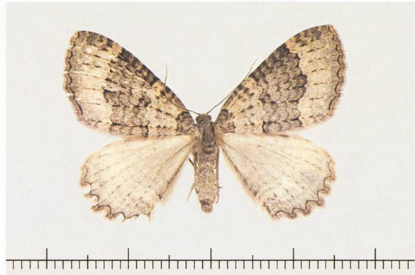
Abb. 12. T. tauteli , ♀, Hägendorf (SO), 13.11.2013