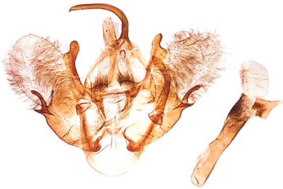
Abb. 16. T. dubitata , ♂.