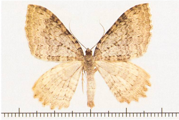
Abb. 1. T. sabaudiata , ♂, Vallorbe (VD), 31.10.2013