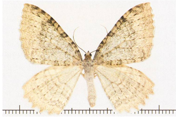
Abb. 2. T. sabaudiata , ♀, Vallorbe (VD), 31.10.2013