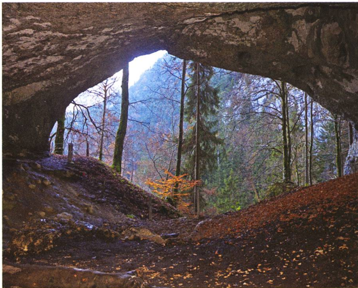
Abb. 30. Vallorbe (VD), Grotte aux Fées

T. tauteli innerhalb des Verbreitungsgebietes von R. alpina . Wo diese Pflanze fehlt, in der Ostschweiz, in Graubünden oder im Tessin, sind bisher auch keine Funde von T. tauteli bekannt geworden. Diese praktisch deckungsgleichen Verbreitungsgebiete von T. tauteli und R. alpina gelten nicht nur für die Schweiz, sondern sind auch in Frankreich, Spanien und Italien (ausser Sizilien) zu beobachten (Redondo et al. 2009).