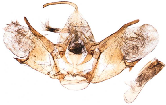
Abb. 15. T. sabaudiata , ♂.

untersucht. Vier erwiesen sich als Weibchen von T. dubitata (Abb. 28). Die verbleibenden 18 Exemplare waren T. tauteli : zehn Weibchen, drei Männchen und fünf mit nicht mehr feststellbarem Geschlecht (Abdomen fehlend oder bereits zu stark verwest). Auch die stichprobeweise Abklärung des Geschlechts bei lebenden Faltern ergab, dass es sich stets um Weibchen handelte, und zwar bei allen drei Triphosa -Arten. Wir konnten also an