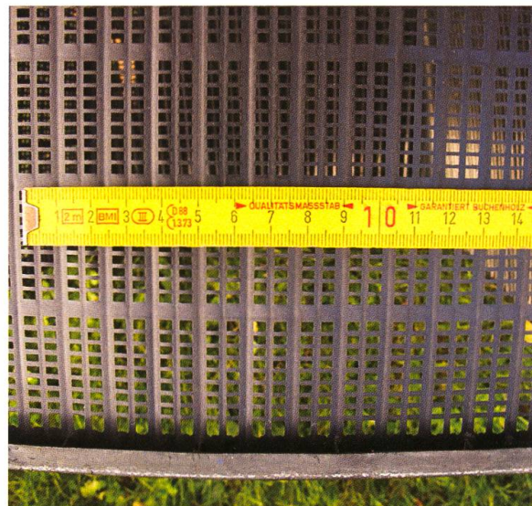
Abb. 3. Das Gitter des Gittereinsatzes sollte weder zu engmaschig, noch zu weitmaschig sein, hier ein Wasserpflanzenkorb.