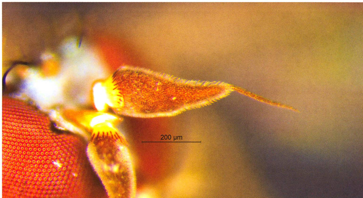
Abb. 2. Systemus tener Loew, 1859, Männchen, Antenne.