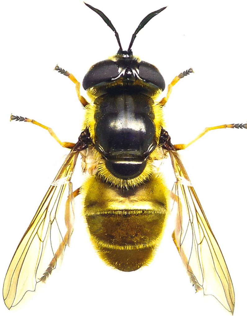
Fig. 1. Habitus de la femelle de Callicera aurata . Les deux bandes de pruinosité blanches qui s'arrêtent au milieu du thorax et les tarsi 2–4 noircis sont bien visibles et sont typiques de cette espèce.

C. aurata est généralement associée à la présence d'arbres âgés ou sénescents disposant de cavités remplies d'eau et de débris en putréfaction où la larve se développe lentement (> 1 an) en se nourrissant de micro-organismes (Rotheray 1991). La larve a déjà été extraite de cavités présentes sur les essences suivantes: Fagus (Rotheray 1991, Dussaix 2005), Quercus (Dussaix 2005), Fraxinus (Ricarte 2008) et Betula (Perry 1997). Dès la fin du mois de mai, les adultes volent au-dessus de la canopée et descendent occasionnellement pour se nourrir sur des fleurs ou pour s'abreuver à proximité d'un ruisseau (Speight 2015). Les femelles, moins sédentaires que les mâles, peuvent être trouvées à une grande distance (quelques centaines de mètres) de la forêt, elles ont déjà été observées sur les genres ou les espèces de plantes suivantes: Crataegus , Calluna , Dipsacus fullonum , Filipendula , Hedera helix , Rosa , Hypericum , Rubus fruticosus , Succisa pratensis et Verbascum (Speight 2015).