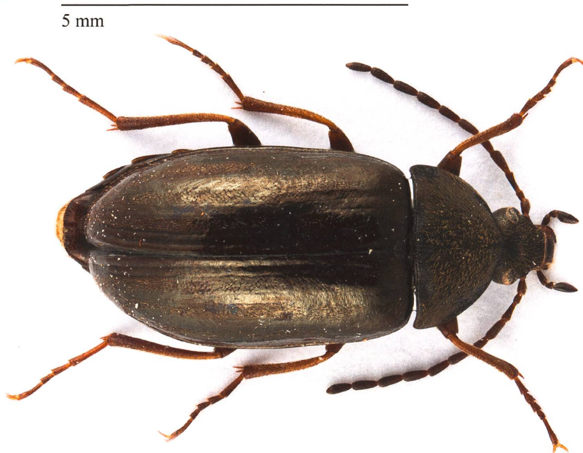
Fig. 1. Habitus de l'individu suisse d' Isomira costessii capturé en 2016 (6,6 mm).

Toutes les espèces d' Isomira citées, qu'elles aient été retenues ou non, font partie du sous-genre nominal (Novák & Pettersson 2008) alors qu'aucune espèce du sous-genre Heteromira Hölzel, 1958 n'était connue de Suisse. La capture d'un spécimen d' Isomira ( Heteromira ) costessii (Bertolini, 1868) en 2016 en Engadine constitue donc la première preuve de présence de ce sous-genre, et donc de cette espèce, dans notre pays. Cette découverte est présentée et mise en perspective avec les autres observations européennes connues.