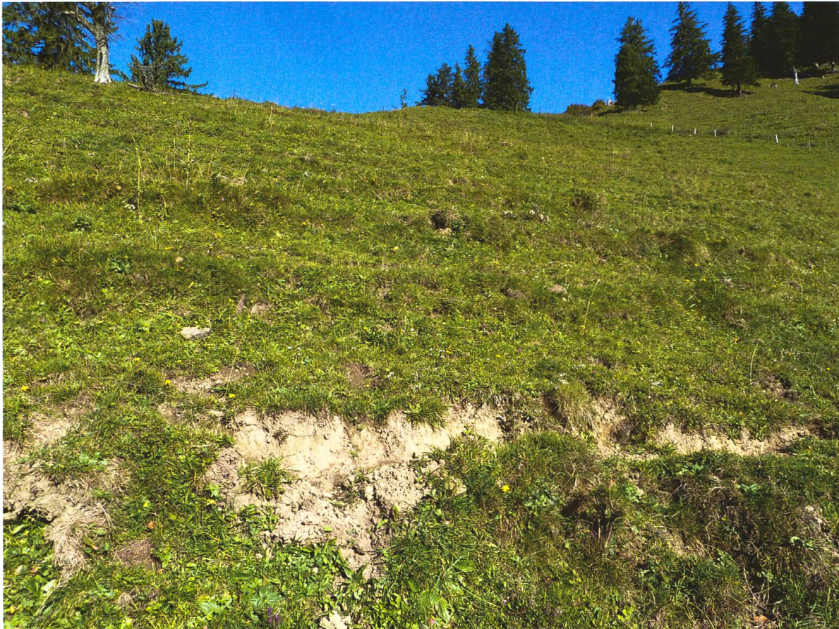
Abb. 2. Fundort von Phengaris (Maculinea) arion (Linnaeus, 1758) auf einer Extensivweide unterhalb des Schnebelhorns (Fischenthal, ZH) auf 1150 m ü. M.

1150 m ü. M. nachweisen (Abb. 1). Das Individuum wurde auf einer extensiv genutzten, südostexponierten, relativ steilen Weide aus der Luft gekeschert. Die Weide zeichnet sich durch Viehweglein und offene Bodenstellen aus (Abb. 2) und war 2016 mit Rindern und Ziegen bestossen. Zahlreiche Pflanzenarten (z. B. Achillea millefolium , Carduus defloratus , Carlina acaulis , Euphrasia rostkoviana , Gentiana verna , Hieracium pilosella , Knautia arvensis , Ononis repens , Plantago media , Thymus pulegioides ) weisen gemäss Zeigerwerten von Landolt et al. (2010) auf eine starke Sonneneinstrahlung und/ oder nährstoffarme Verhältnisse hin.