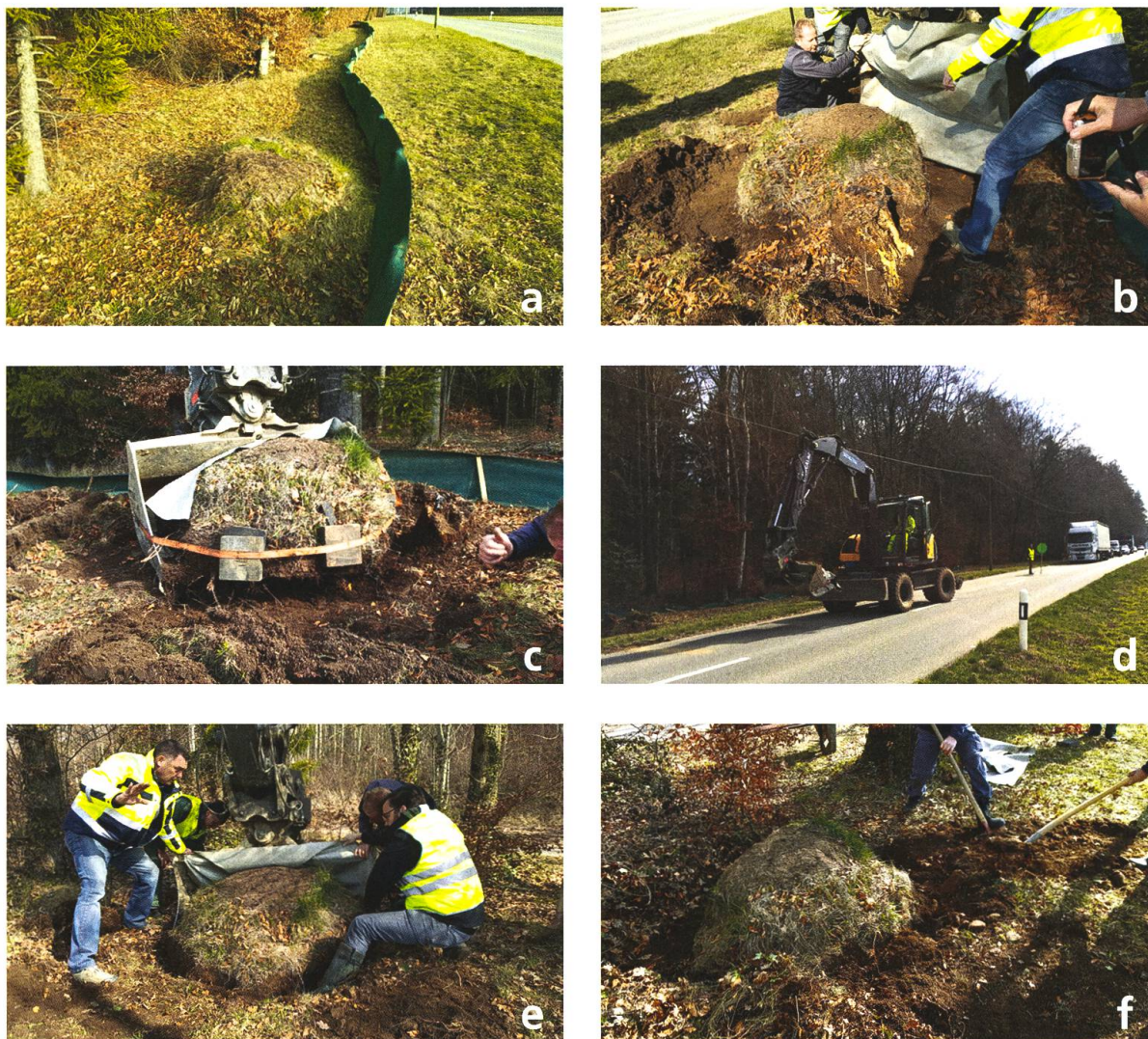
Fig. 2. Illustrations des étapes clés de la translocation de la fourmilière de Formica pratensis réalisée à Gimel en date du 23 mars 2016.