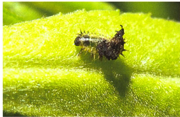
Abb. 2. Imago von Cassida ferruginea (links) und Abb. 3. Junge Larve von C. ferruginea mit typischer Kot-Tarnung (Länge ca. 4 mm).

dem Kanton St. Gallen jedoch vor 1900 gesammelt wurden (Degersheim, Goldach, Berneck und Weesen). Herger (2002) führte C. ferruginea (teste L. Sekerka) aus dem Rüss-Spitz auf, welche 1987–1989 gesammelt worden waren. Nur aus der unmittelbaren Nähe der Schweiz im Rheintal und aus der Umgebung des Bodensees im österreichischen Vorarlberg konnte Cassida ferruginea bis 1995 mehrfach in Riedgebieten nachgewiesen werden (Brandstetter & Kapp 1996, 1998). Dies weist darauf hin, dass bei uns in günstigen Habitaten mit Beständen der Wirtspflanzen ebenfalls Nachweise zu erwarten wären. Erst die Durchsicht der im Allgemeinen für die Schweizer Fauna sehr repräsentativen Sammlung des Naturhistorischen Museums der Burgergemeinde Bern ergab weitere Belegtiere (geordnet nach Datum): 1 ex. Bern, leg. F. v. Ougsburger, coll. A. Rätzer (undatiert, vor 1900); 1 ex. Bern, coll. Rätzer (undatiert, vor 1907); 1 ex. Bern, 8.5.1878, coll. A. Rätzer; 1 ex. Busswil (BE), 21.5.1886, det. Bugnion, coll. A. Rätzer; 1 ex. Belp (BE), 25.5.1888, coll. Rätzer; 1 ex. Bern, 17.6.1888, coll. A. Rätzer; 2 ex. Rubigen (BE), 22.6.1891, coll. F. Benteli; 1 ex. Büren (BE), 28.6.1891, coll.