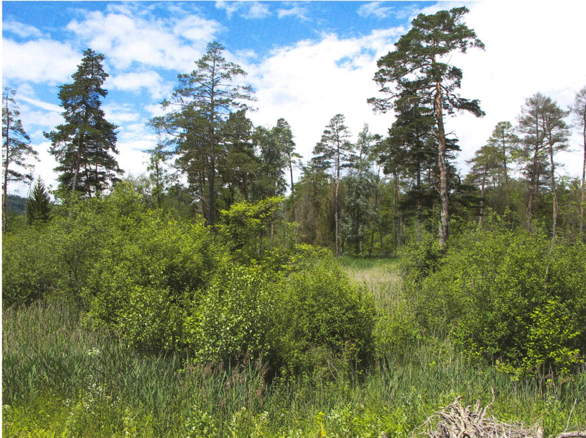
Abb. 4. Habitataspekt des Schilfgebiets im Selhofenzopfen im Juni 2016.

A. Rätzer; 1 ex. Siselen (BE), 6.1894, coll. A. Rätzer; 1 ex. Biel (BE), 29.4.1905, leg. E. Herrmann; 1 ex. Allondon (GE), 13.5.1964, leg & coll. P. Scherler, det. D. Sassi 1993. Der Letztere gehört, neben den Funden vom Rüss-Spitz, zu den gegenwärtig rezentesten Funden der Art aus der Schweiz und bestätigt ein Vorkommen für den Kanton Genf, da C. ferruginea in der letzten Checkliste (Blanc et al. 2012) fehlt. Zudem liegen aus dem Naturhistorischen Museum Basel folgende Belege vor (teste L. Sekerka): 1 ex. Mendrisio (TI), 10.–24.7.1940, leg. Allenspach; 1 ex. Salorino (TI), 8.1940, leg. J. Lautner; 1 ex. Schlieren (ZH), 17.10.1953, leg. J. Lautner