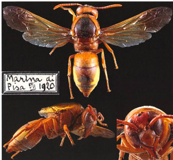
Abb. 1. Präpariertes ♀ (I, Toscana, Marina di Pisa; Juli 1920, A. Nadig leg.; ETHZ coll.) von Rhynchium oculatum oculatum (Fabricius, 1781).

Die zu den Faltenwespen (Vespidae) gehörende Unterfamilie der Lehmwespen (Eumeninae) umfasst weltweit über 3000 solitäre Arten. In Europa sind es 226 Arten in 37 Gattungen (Fauna Europaea 2017), in der Schweiz 75 Arten in 21 Gattungen (Neumeyer 2014). Alle ausser Discoelius verwenden als Baumaterial für ihre Nester einen lehmartigen Mörtel aus mineralischem Bodenmaterial, Wasser und Drüsensekreten.