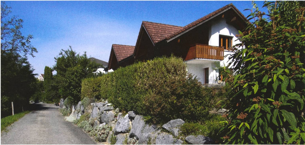
Abb. 2. Rand des Hausgartens Caspärch 5 in Jenins (GR), aufgenommen am 3.9.2016, in welchem das ♀ von Rhynchium oculatum oculatum (Fabricius, 1781) aus Abb. 3 am 20.8.2016 entdeckt wurde. Auf der Bruchsteinmauer wächst eine Buchsbaumhecke ( Buxus sempervirens L.) mit Frassschäden durch Raupen des Buchsbaumzünslers ( Cydalima perspectalis).