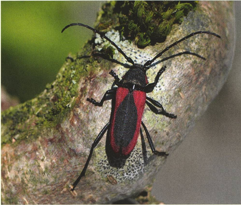
Purpuricenus kaehleri (Purpurbock), geschlüpft aus Ästen einer Eiche aus Leuk.