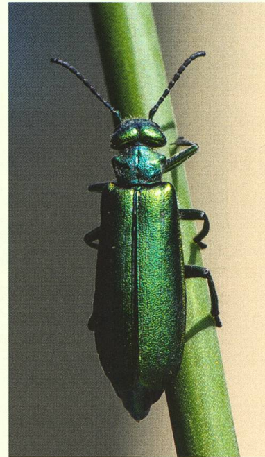
Lytta vesicatoria , die «Spanische Fliege».

Ausschlupflöcher vom bis zu 6 cm grossen Mulmbock Ergates faber zu sehen, der in der Schweiz nur im Wallis vorkommt. Gegen Mittag zog Regen auf. Daher begab man sich bereits früh wieder zurück auf die Alpennordseite.