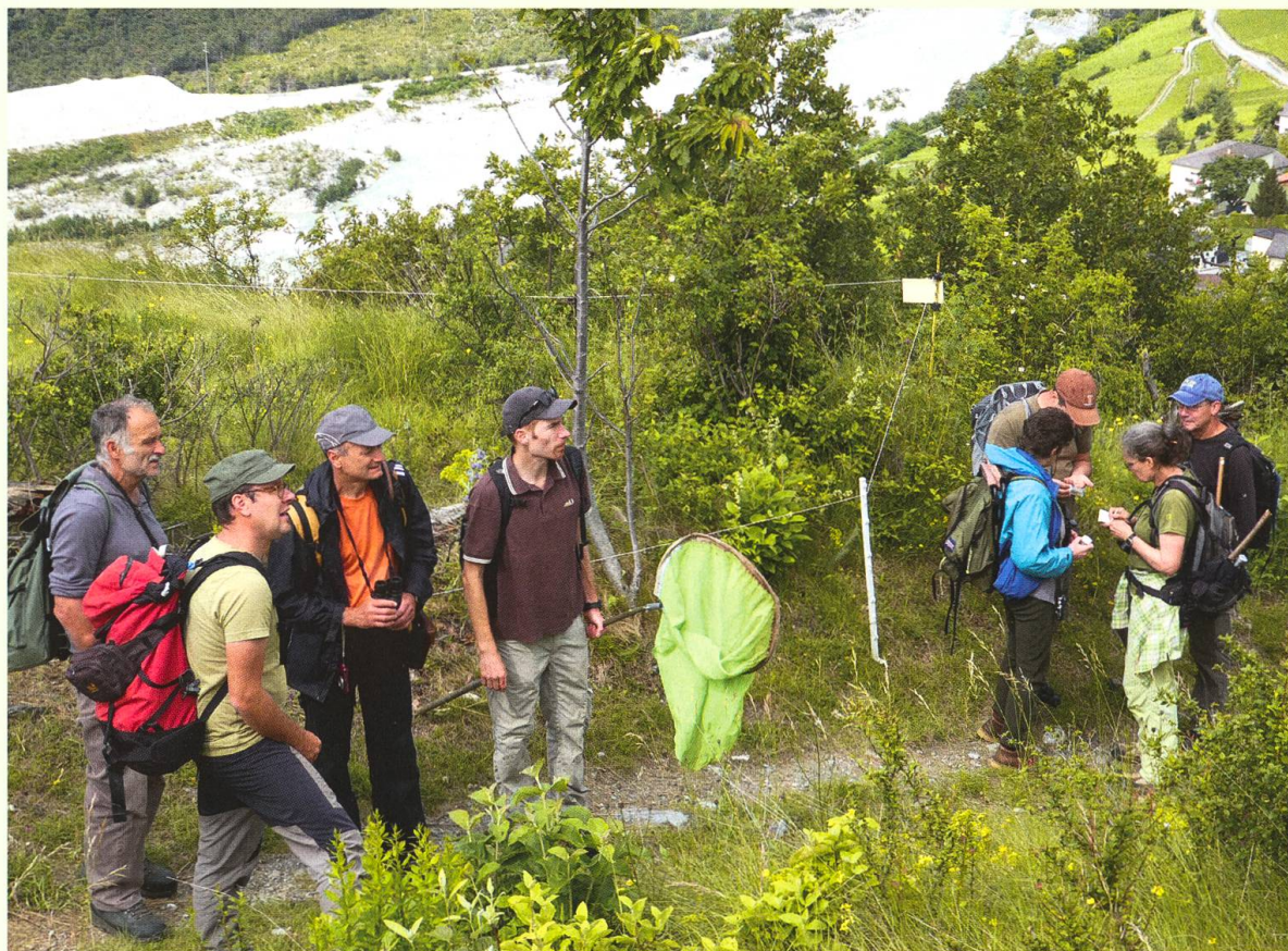
Teilnehmende des EVB-Ausfluges im Gebiet oberhalb von Leuk.

Am Sonntag bewegte sich die ganze Gruppe des EVB zum Waldbrandgebiet ob Leuk und suchte gemeinsam nach Sechsbeinern. Mit von der Partie waren auch zwei Kinder von Mitgliedern, die sich zwar bisher nicht kannten, aber an der gemeinsamen Jagd nach Käfern ihre Freude hatten. An den liegenden Föhrenstämmen waren viele