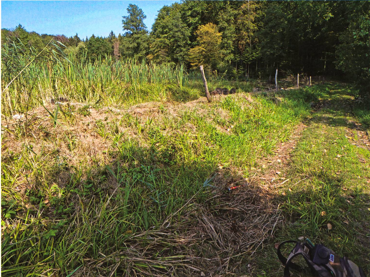
Abb. 1. Bonfö, Queues de Chats, 28.8.2018: Fundort von Amara concinna.