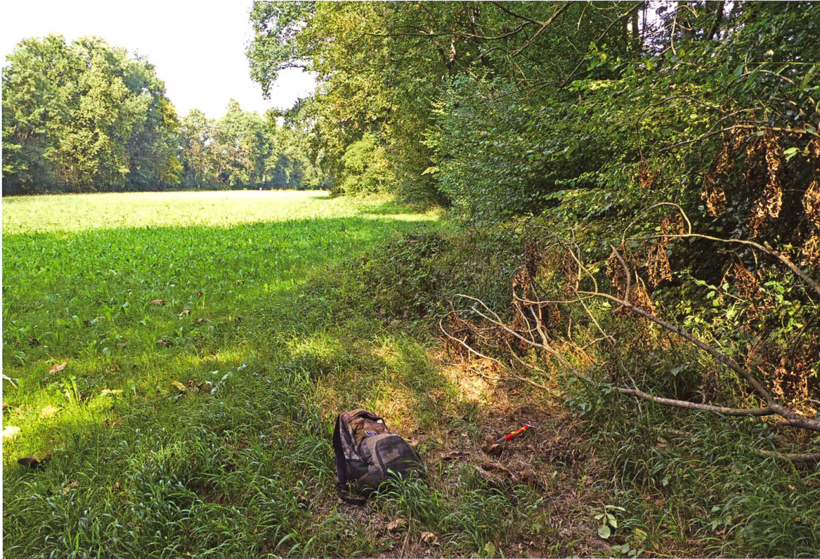
Abb. 3. Mendrisio, Genestrerio, 17.9.2018: Fundort von Agonum antennarium.