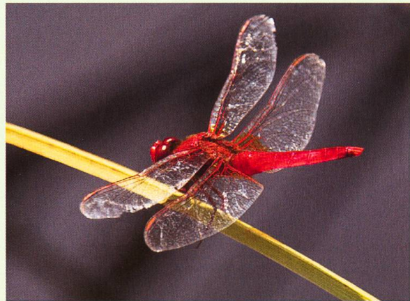
Hier wird ein neu angelegtes Flachgewässer begutachtet, an dem sich mehrere Libellenarten wie z. B. die Feuerlibelle Crocothemis erythraea eingefunden haben und sich am Boden fotografieren lassen.

Als Nächstes besuchen wir die Dietiker Limmatauen , Reste einer einst grossartigen Auenlandschaft, die heute von einer Autobahn durchschnitten werden und linksseitig direkt an ein dicht überbautes Industriegebiet grenzen. Geblieben sind nach der Limmatkorrektion im späten 19. Jahrhundert einige Altläufe mit Röhrichtgürteln, Hartholzaunen und ausgedehnte, durch regelmässige Mahd offen gehaltene Seggenfluren. Der Wasserstand schwankt mit dem Abfluss der Limmat, sodass im Frühsommer oft grössere Flächen überschwemmt werden. Mitten drin hat man den Eindruck einer nahezu natürlichen Auenlandschaft; lediglich das hoch aufragende Kamin der KVA Dietikon erinnert daran, dass wir uns auf einer Naturinsel im weitgehend überbauten Limmattal befinden. Ornithologisch interessierte Besucher haben hier Gelegenheit, aus einem Versteck heraus Wasservögel auf der Limmat mit ihren renaturierten Ufern zu beobachten, wo sich gerade Kolbenenten, Kormorane und