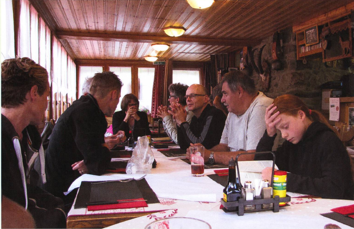
Die Teilnehmenden beim Abendessen.

mit Hannes vom Hotel aus in Richtung Lac Bleu auf. Der schmale Pfad in sehr steilem Gelände verlangte grosse Aufmerksamkeit. Trotzdem waren die vielen floristisch und auch entomologisch artenreichen Wiesen augenfällig und luden immer wieder zu einem ausgedehnten Halt ein. Gegen Ende des Tages traten die Teilnehmenden individuell die Heimreise an.