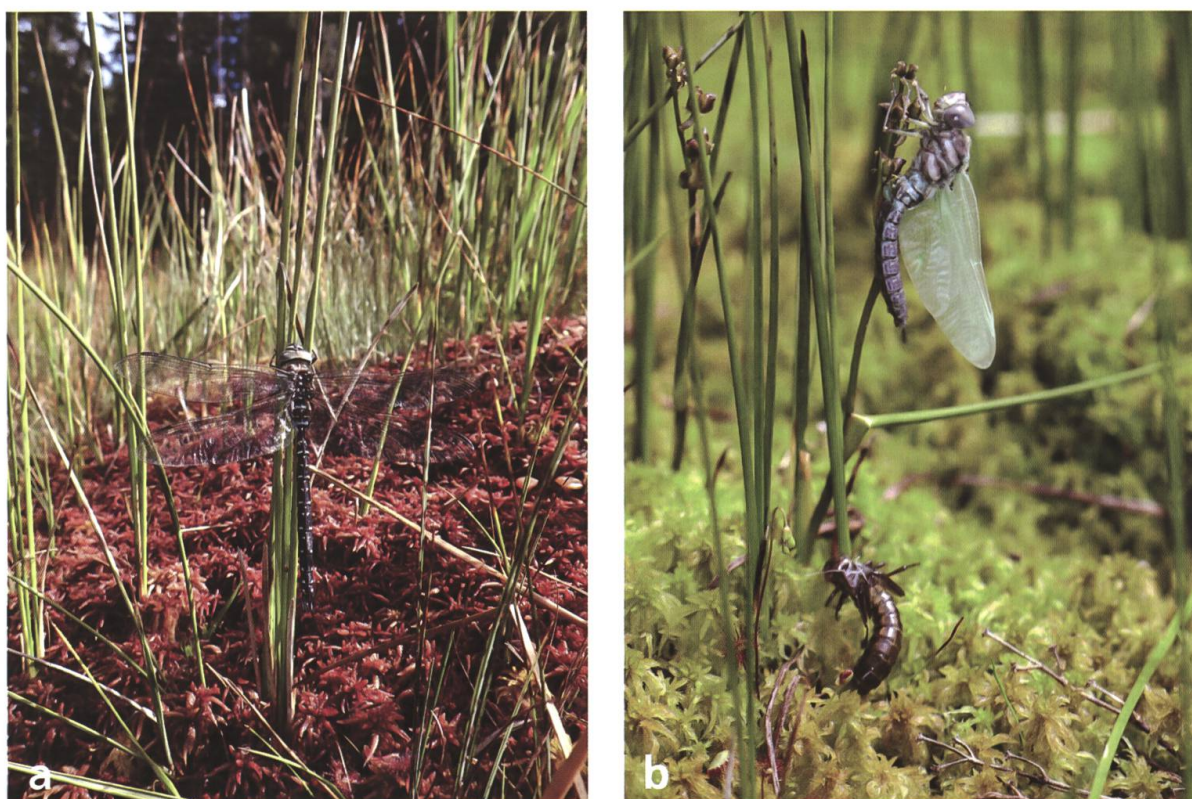
Fig. 2 a ). Aeshna subarctica mâle adulte. b ) Femelle en cours d'émergence accrochée à une Scheuchzérie des marais et son exuvie.

préservier ces sites fragiles, la localisation précise des tourbières visitées n'est volontairement pas communiquée ici.