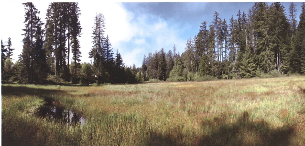
Fig. 1. Tourbière des Préalpes fribourgeoises dans laquelle se développe A. subarctica .