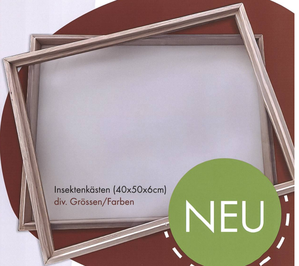
Insektenkästen (40x50x6cm) div. Grössen/Farben