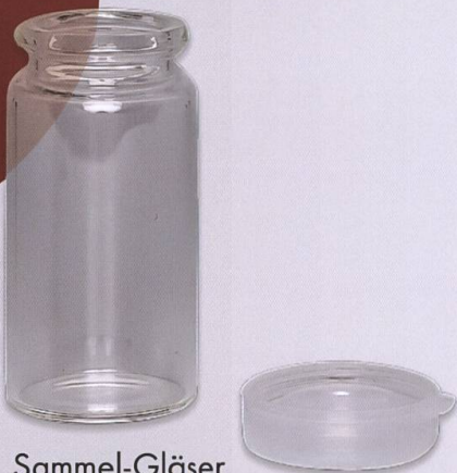
Sammel-Gläser mit Schnappdeckel div. Grössen