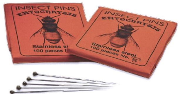
Präparationsnadeln, aus rostfreiem Stahl div. Grössen