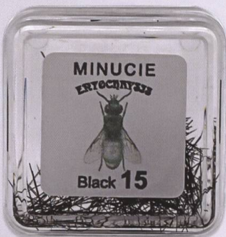
Minutiernadeln für Insekten, schwarz div. Grössen