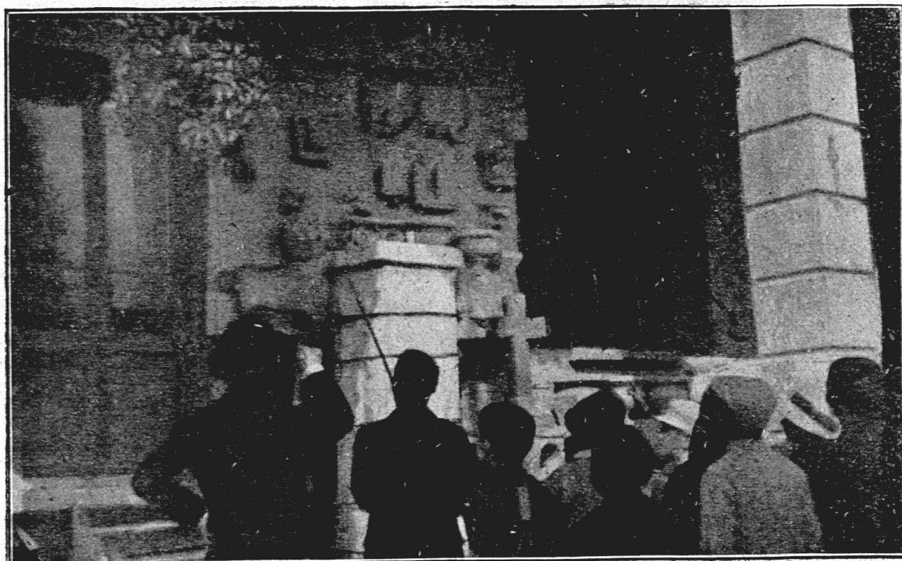
Scuole Comunali di Lugano: Visita allo Stabilimento Vicari.

Se al docente l'orizzonte si mostra ampio e se crede di non poter tutto studiare e visitare, non è il caso di preoccuparsi. Lo scopo delle lezioni