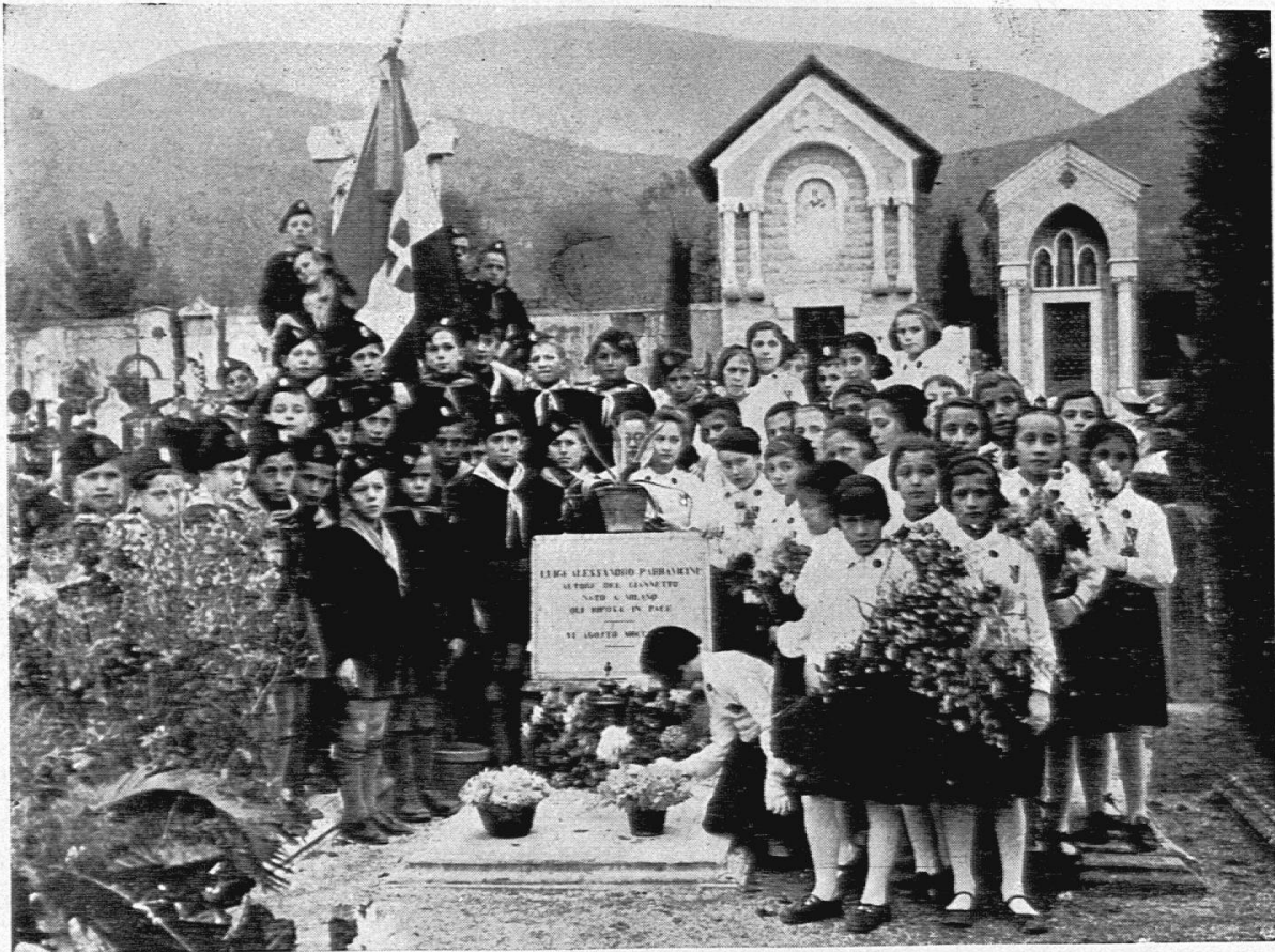
Tomba di L. A. Parravicini a Vittorio Veneto.

Vittorio Veneto, che custodisce gelosamente le spoglie mortali del suo figlio di adozione, ha intitolato al suo nome un edificio scolastico e la via su cui questo