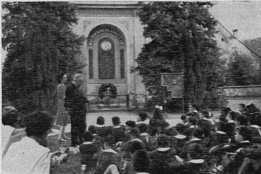
Sulla tomba di E. Pestalozzi

Sulla via ghiaiosa passava uno di quei grandi carri cisterna dell'altopiano svizzero. Alcune donne e alcuni ragazzi, dalle soglie vicine, osservavano. Da una rimessa veniva il tramestio di quando si attaccano cavalli ai veicoli.