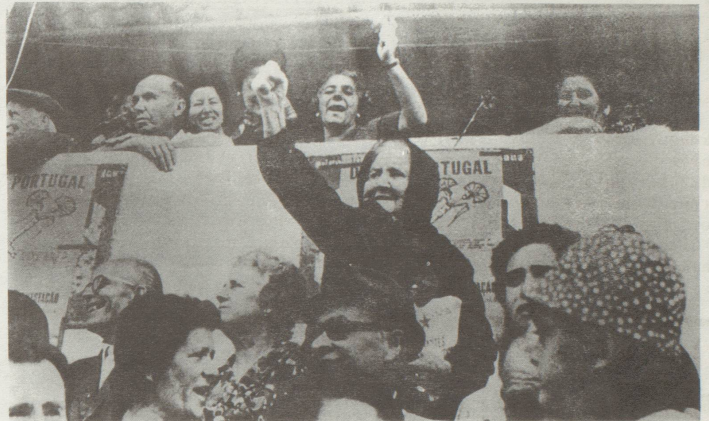
Avante! - Der Sturz des Faschismus und die revolutionär-demokratische Umwälzung haben auch für die fortschrittliche Frauenbewegung Portugals neue Bedingungen geschaffen. Vgl. Artikel Seite 4.

Im Juni kam der "Abtreibungsball" zum Ständerat, von dem schon gar nichts Fortschritt-