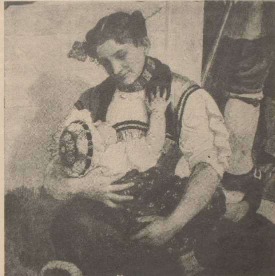
Das neue Vorbild für die entlassenen Frauen?

Teilzeitarbeiterinnen und Zweitverdiener, das sind Frauen. Nach dem Gesetz ist nämlich immer noch der Mann der Ernährer der Familie. Doch die Wirklichkeit richtet sich