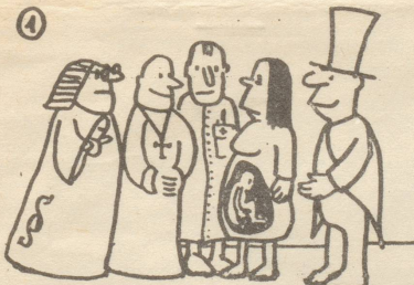
Schützt das Leben...

Die Kommunisten traten für die Freigabe der Abtreibung ein, während die Sozialdemokraten sich nicht zu einer einheitlichen Haltung im Interesse der Frauen und der Arbeiterfamilien durchringen konnten: Eine Minderheit unterstützte zwar ebenfalls die Forderung der Freigabe, aber die Mehrheit neigte zum Kompromiss, sie unterstützte die Indikationslösung, die auch die soziale Indikation miteinbeziehen sollte.