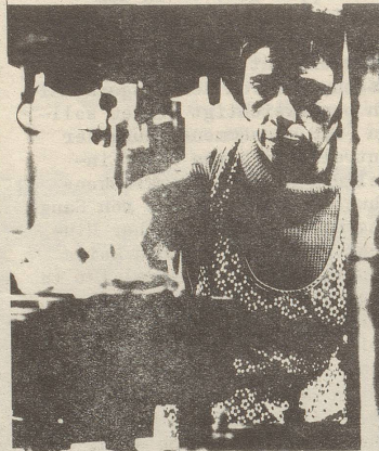
Als billige Arbeitskräfte begehrt, als Menschen nicht akzeptiert!

Wer aber in Italien keine Verwandten hat, muss sich hier arrangieren, aber spärlich sind die Kinderkrippen, inexistent die Ganztageschulen. Manchmal hören wir den Vorwurf, wir seien böseartig und verantwortungslos, weil wir unsere Kinder in zwei Zimmern "halten" müssen. Man sagt uns der Staat erlaube das nicht. Gleichzeitig unternimmt derselbe