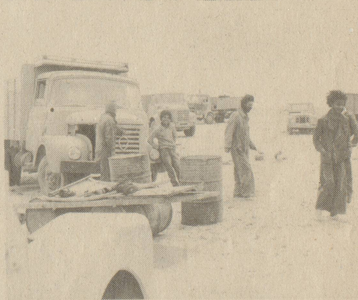
oben : 1 Brunnen mit Elektropumpe für ein Lager mit 18 000 Bewohnern - Frauen, Kinder, Alte. Keine sanitären Einrichtungen. 1 "Kinderspital" mit 25 Pritschen. Täglich sterben 4 bis 8 Kinder an Mangelkrankheiten. unten : Auto-Reparaturwerkstätte im Freien. Ingeniosität muss mangelndes Werkzeug ersetzen.