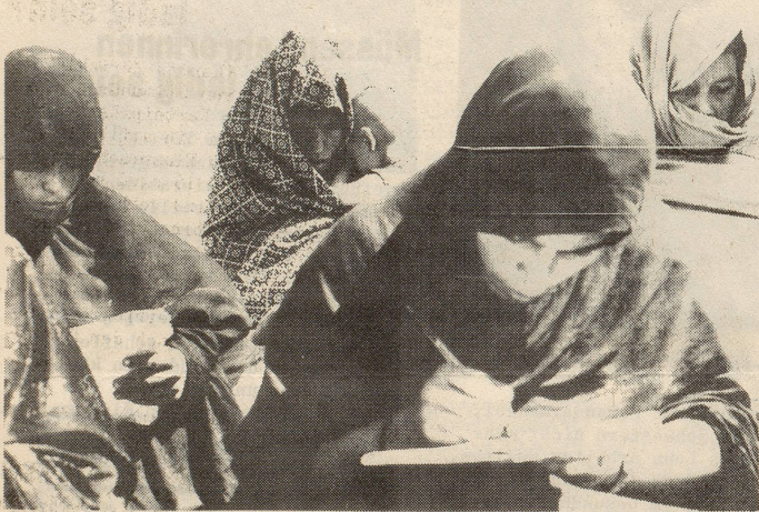
Schulung: Wichtiger Schritt zur Verwirklichung der Gleichberechtigung

Immerhin sind bereits bis heute zwei wichtige Schritte in dieser Richtung unternommen worden: Das Polygamie-Verbot (die Saharaische Republik ist eines der ersten arabischen Länder, die diesen wichtigen Faktor der Befreiung der Frau erfüllt haben) und die Schulung. A0