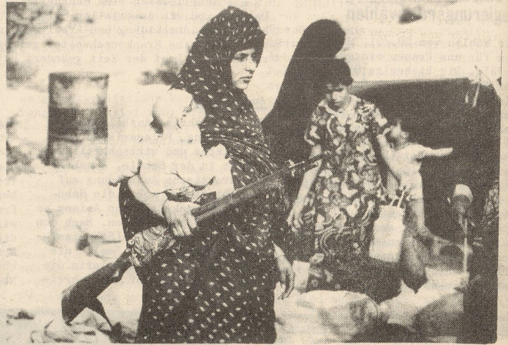
Aktive Teilnahme am Befreiungskampf

Männer trifft man kaum in den Lagern, Kleinkinder nur wenige (sie haben die Flucht zu Fuss und bei nächtlichen Temperaturen von -4 Grad nicht überlebt). Es sind die Frauen und die Halbwüchsigen, die das Leben und