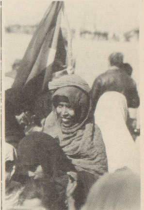
Am 20. Mai feierten die Sahrauis den Beginn ihres Unabhängigkeitskampfes vor 4 Jahren. (vgl. Augenzeugenbericht S. 41)

Doch, wir wehren uns mit allen Mitteln gegen den Sozialabbau. Und die OFRA hat alle Frauenorganisationen aufgerufen, dem Sparpaket und der Mehrwertsteuer eine klare Abfuhr zu erteilen. Wir unterstützen das Referendum gegen das "Sparpaket"! Wir stimmen am 12. Juni NEIN zur Mehrwertsteuer.