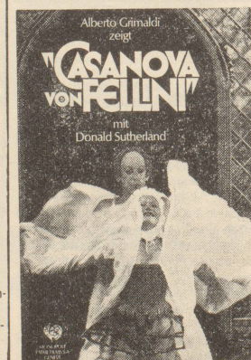
Noch einmal: Casanova

Wir Frauen in der Redaktion waren uns keineswegs einig über den Film "Casanova" von Fellini. Darum haben wir beschlossen unsere Leserinnen an der Diskussion teilnehmen zu lassen. Während wir in der Mai-Nummer der "Emanzipation" die Meinung: "der Film zeigt ein Stück Realität, er ist empfehlenswert" zu Worte kommen liessen, wollen wir jetzt einer Gegenposition Platz geben. Die Autorin sagt: "Früher war ich glühende Fellini-Verehrerin".