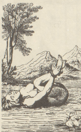
Ist sie eine Hexe?

Im Kampf gegen alte vorchristliche Bräuche und Vorstellungen verdammt die Kirche diese als heidnischen Irrglauben, als vom Teufel eingegebenen Wahnvorstellungen. Die zahlreichen Verbote (ca. 5. – 9. Jh.) gegen Zauberei, Giftmischerei, Wettermachen etc. zeigen, wie weit verbreitet solche alte Vorstellungen noch waren. Im 12. Jahrhundert bürgerte sich die Verbrennung als Strafe gegen Ketzer in Nordfrankreich und Deutschland ein. Den Ketzern wurde Verhöhnung des christlichen Glaubens vorgeworfen und Huldigung des Teufels, Zauberei gingen einen Bund mit dem Teufel ein. Dies galt seit der Mitte des 13. Jahrhunderts als wissenschaftliche Lehrmeinung, war also bewiesen und wahr. Der Teufelspakt, der zauberische Kräfte gibt, wurde auch zum Kennzeichen der Hexe. Vereinzelt Prozesse wegen solcher Vergehen gab es zur Zeit des 'dunklen' Mittelalters, das für die Frauen wohl dunkel, aber im Vergleich zu dem, was nachher kam, noch leicht zu nennen ist. Im 16. und 17. Jahrhundert forderten dann die Hexenprozesse Millionen von Opfern, diese Opfer waren vor allem Frauen. Wie kam es zu diesem Vernichtungskampf gegenüber den Frauen?