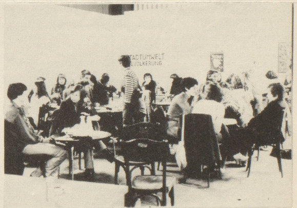
Frauen unter sich

"wir (frauen) wollen nicht bestehende kunststrichungen verändern, da wir uns dort männlichen normen anpassen müssten. andere gruppen (künstler) gehen von bestehenden aus und können im gegensatz zu uns ihre bedürfnisse und forderungen formulieren. wir nicht. unsere ausgangssituation ist anders. unsere wirklichkeit ist in den bestehenden formen (kunst und gesellschaft) nicht vorhanden, oder manipuliert. Das bild, das von männern in kunst oder werbung von uns gemacht wird, ent-