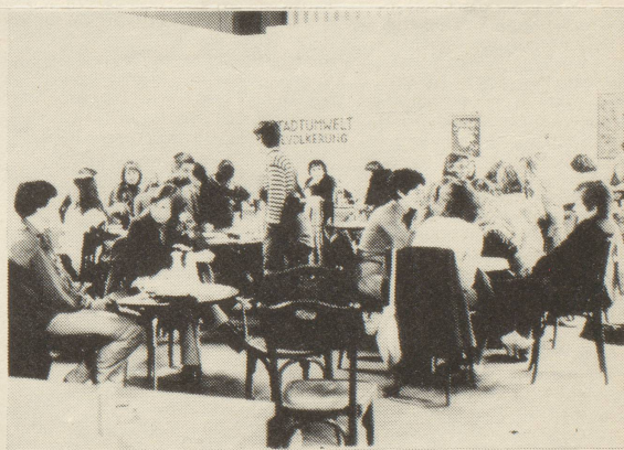
Frauen unter sich

"wir (frauen) wollen nicht bestehende kunststrichungen verändern, da wir uns dort männlichen normen anpassen müssten. andere gruppen (künstler) gehen von bestehenden aus und können im gegensatz zu uns ihre bedürfnisse und forderungen formulieren. wir nicht. unsere ausgangssituation ist anders. unsere wirklichkeit ist in den bestehenden formen (kunst und gesellschaft) nicht vorhanden, oder manipuliert. Das bild, das von männern in kunst oder werbung von uns gemacht wird, ent-