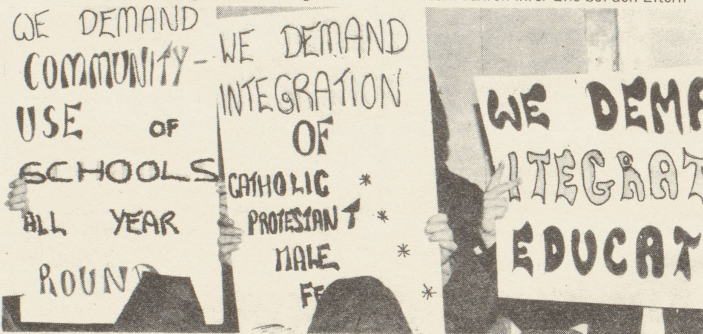
Auf Plakaten fordern irische Frauen die Aufhebung der nach Konfession und Geschlechtern getrennten Schulbildung

Nur verhältnismässig wenige Frauen erlangen