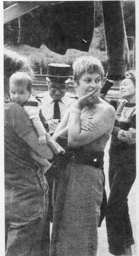
Ob sie ein bisschen enttäuscht waren, dass sie nur Namen aufschreiben mussten und keine blutten Frauen sahen?

Mich hat das Frauenlager auch dieses Jahr wieder aufgestellt: ganz neue Frauen kennenlernen, massieren, diskutieren, kochen, essen, schlafen, schwimmen, faulenzeln, ... So wirklich fast ein bisschen paradiesisch! Im wörtlichen Sinn, denn wir sind recht bald einfach im Evakostüm herumgelaufen und haben nur das getragen, was uns gerade praktisch war. Der Abwart-Lehrer-Gemeinde-