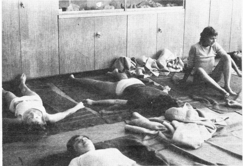
1 x massieren, ein Crawl-Kurs, oder – wie hier – eine kurze Einführung in die Eutonie von Lilo

Dieses Jahr habe auch ich es gewagt, am Frauenlager teilzunehmen. Trotz dem Stress mit den vielen Kleinkindern (11 unter 4 Jahren, meine gehörten dazu) in der zweiten Woche, war für mich eine grossartige Erfahrung, dass es möglich ist, eine Woche lang mit so vielen fremden Frauen und Kindern,