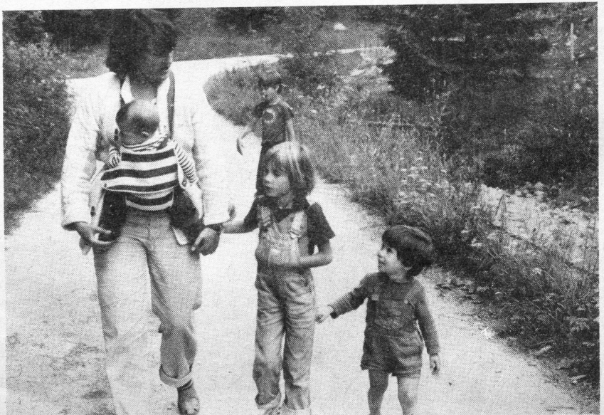
„Der praktische Kindergriff“