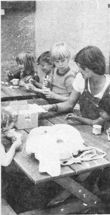
Zeit für Frauen – Zeit für Kinder. Werden unsere Kinder einmal ein bisschen anders sein?

schreiber hatte auch nichts dagegen, und uns war es sehr wohl. Aber nur bis Donnerstag, 13.30 Uhr. Da rückte eine besorgte 4-er-Mannschaft der Kantonspolizei Moutier mit Mannschaftswagen an, um doch festzustellen, wer den in einem „solchen Tenue“ sich im Freien aufhalte. Nach einer Diskussion aller Frauen haben wir dann beschlossen, unsere Namen anzugeben, damit wir nicht mit Rausschmiss usw. zu rechnen brauchten. Die Polizisten behaupteten, dass ein Gemeinderat angerufen habe. Am Abend erfuhren wir, dass der zitierte Untersuchungsrichter die Sache als Bagatelle bezeichnet habe und nicht mit einer Verfolgung zu rechnen sei. Herr Stolz berichtete uns dann, dass lediglich ein Bürger von Schelten sich erkündigt habe, ob denn „blutt baden“ eigentlich schon gesetzlich erlaubt sei. (Im Kanton Bern können nämlich Gemeinden Oben-ohne-baden erlauben). Das war aber nur eine Episode. Sonst hat ziemlich alles wunderbar geklappt. Zita