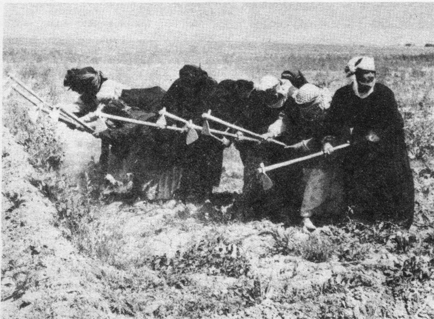
Perserinnen bei der Landarbeit