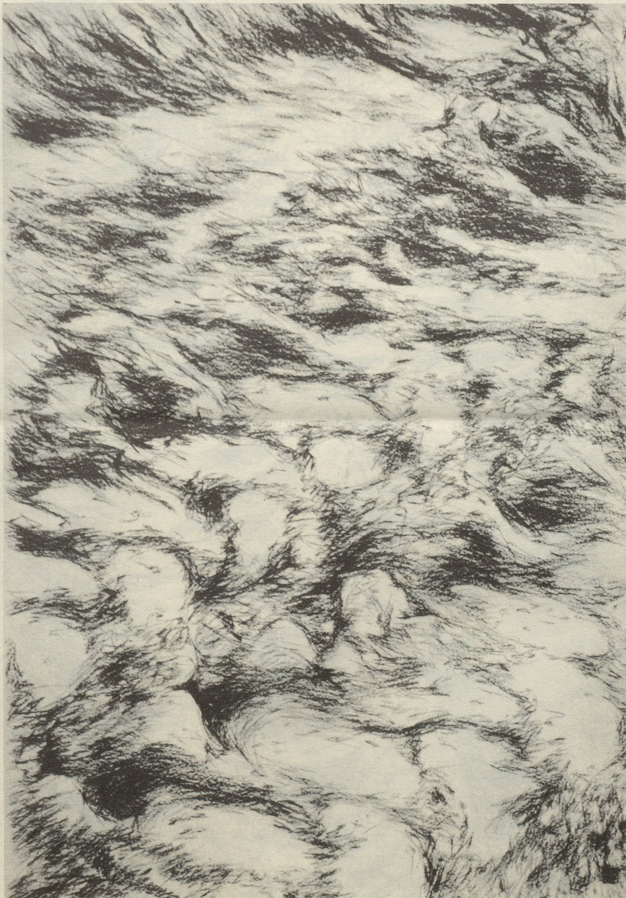
“Spuren” Ölkreide 70 x 100

Jahrgang 1952, lebt und arbeitet zur Zeit in Basel