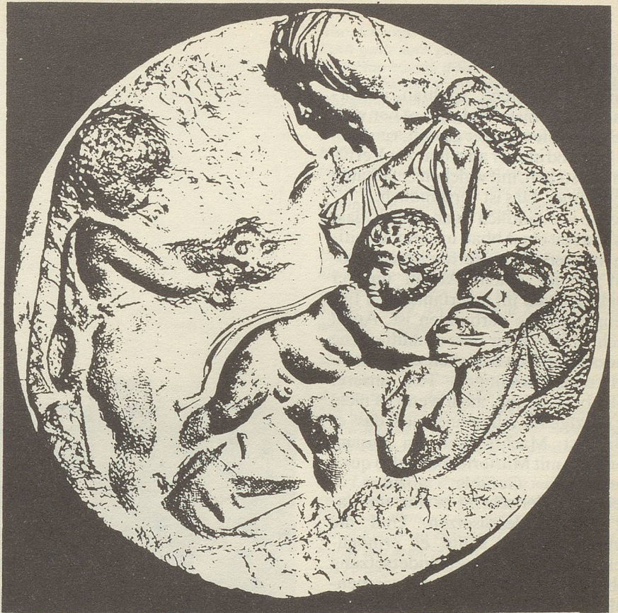
Michelangelo, 16. Jh.

Ich finde es allerdings mehr als gefährlich, den Männern insgesamt all diese "weiblichen Werte" abzusprechen und vor allem, uns Frauen auf nur diese Werte, unsere Mütterlichkeit, reduzieren zu lassen. Denn dass diese Form von Mütterlichkeit für uns konstruiert und mittels gross angelegter Kampagne als Ideal für alle Frauen vor rund 150 Jahren durchgesetzt worden ist, um uns an Heim und Herd zu binden, ist mittlerweile durch die historische Frauenforschung bekannt geworden. Durch ihre "öffentliche Mütterlichkeit", ihr Wirken am Wohltätigkeits- und Sozialbereich, haben sich die Frauen — allerdings ganz im Einverständnis mit dem Patriarchat — einen Machtbereich geschaffen, dessen Kehrseite ihre politische Ohnmacht ist. Sicher würde es sich lohnen, die gesellschaftspolitische Arbeit der Frauen, ebenso wie ihre