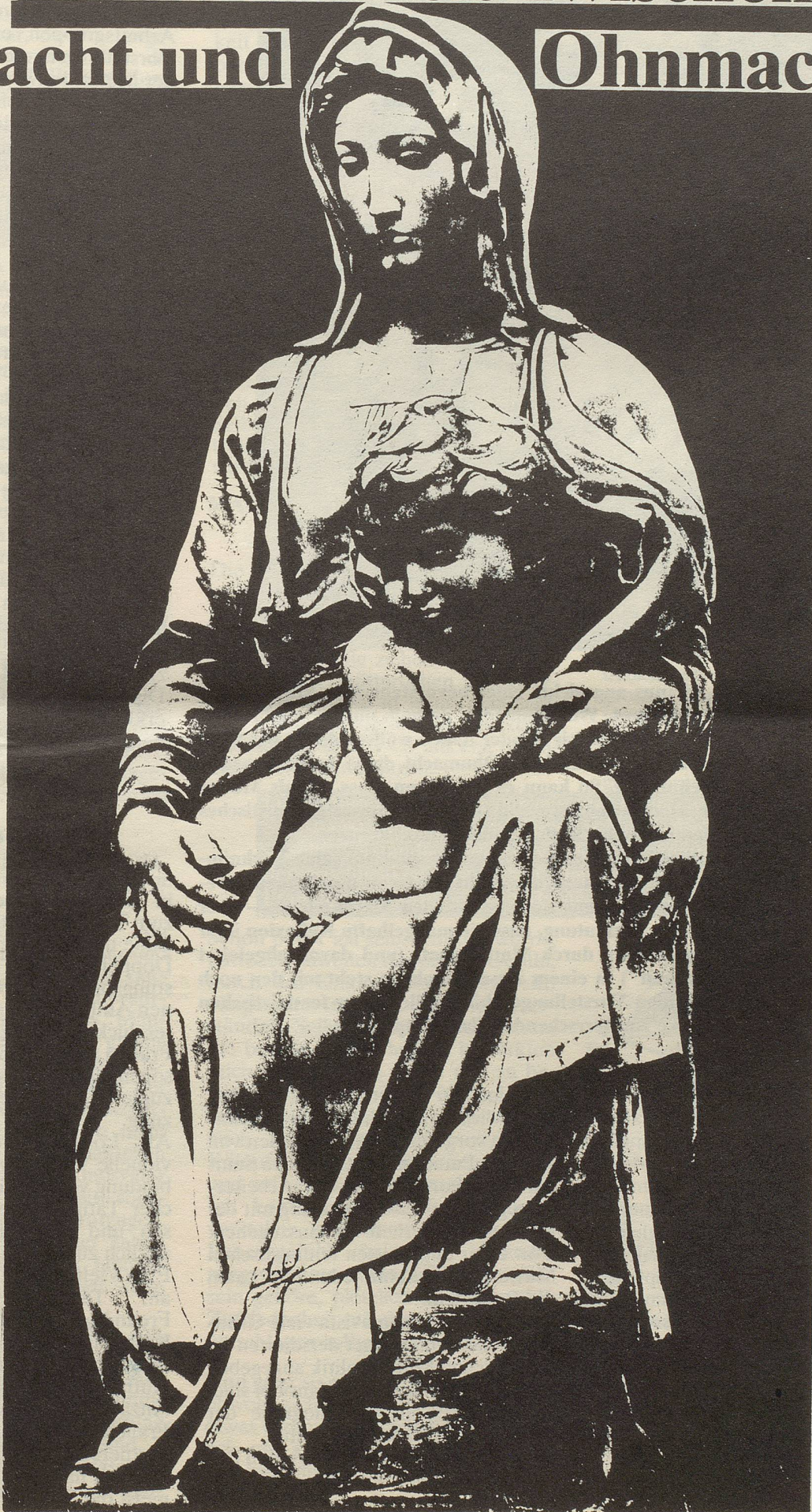
Michelangelo, 16. Jh.