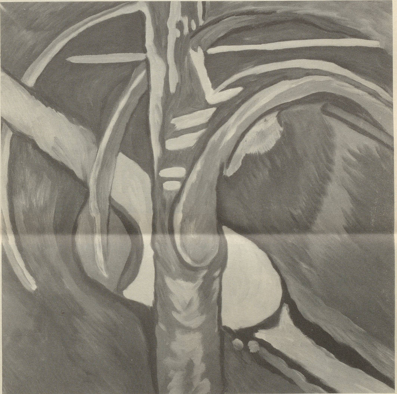
...nach der Mitte