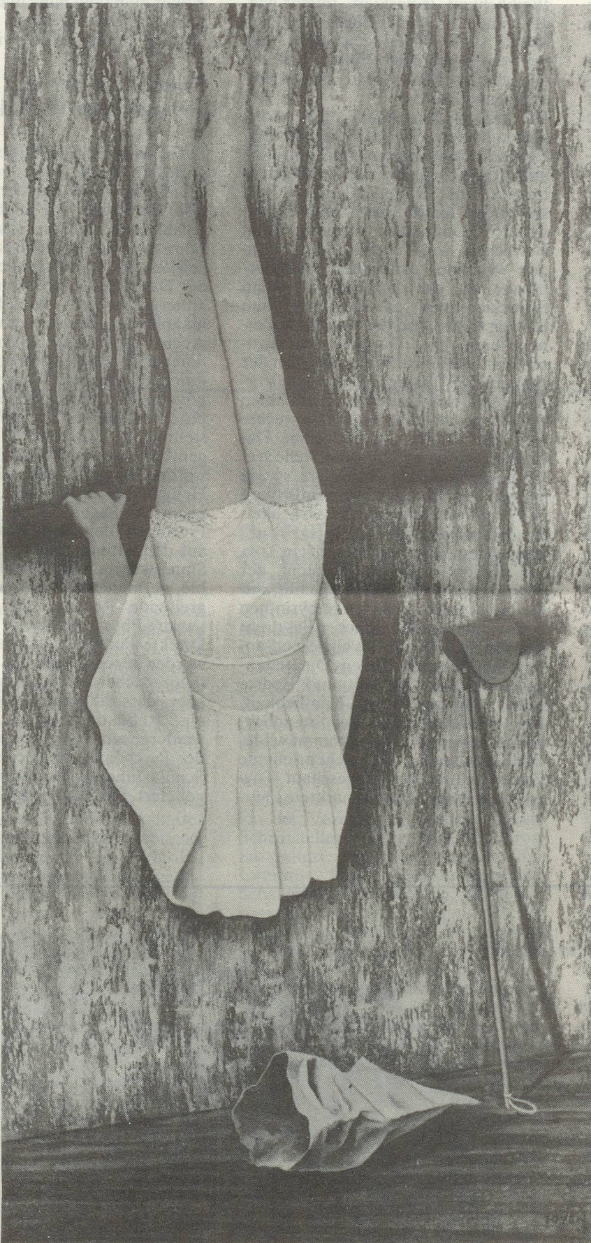
Nach der Vorstellung, 1943