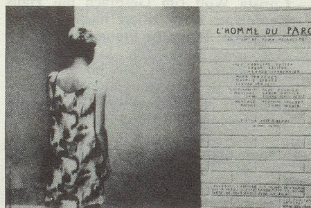
„L'homme du parc“