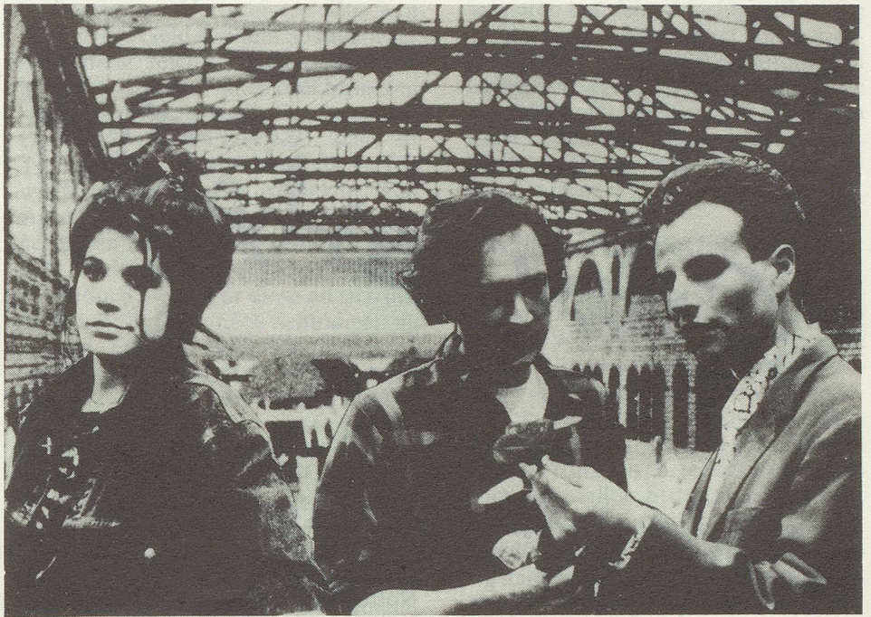
„Aus allem raus und mitten drin“

den Durchbruch, der triumphal gefeiert wird.