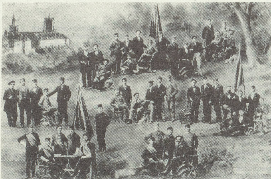
Cherchez la femme ...

Wie kam es dazu, dass von offizieller Seite das Thema „Frauenförderung“ aufgenommen wurde? Ohne Druck seitens der Frauen wäre wohl nichts in dieser Richtung unternommen worden?