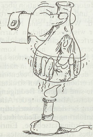
Cartoons aus Berlinerin 10/88