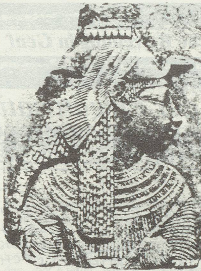
Relief einer Göttin (Isis?) mit Geierhaube. Ägypten, 1. Jh. v. Chr.

Ich fühle mich durchaus als Feministin, nur ist dieser Begriff sehr schillernd, und es lassen sich sehr verschiedene Positionen darunter subsumieren. Im vierten Teil meines Buches versuche ich, klarzustellen, dass sowohl der egalitaristische